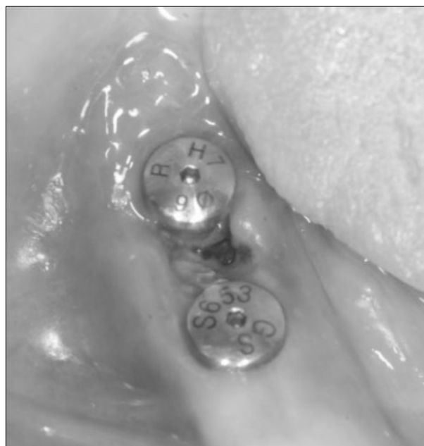
Fig. 1. Preoperative intraoral clinical photo.

임플란트 연관 약골괴사(implant-related ONJ)는 비교적 시간이 경과한 후에 발생하는 합병증으로 발병 빈도가 다른 외과적 술식(surgical procedure)에 비하여 상대적으로 낮다 27 ). 하지만 4년 이상 경구 복용(oral BPs)시 유병률(prevalence)이 증가하여 고위험군(high risk group)으로 포함되므로 26 , 수술 전 환자 평가시 골 괴사(bone necrosis)나 임플란트 실패(implant loss)와 같은 합병증은 충분히 설명해야 하며, 해당 과와 긴밀한 협조 체계(consultation)가 반드시 있어야 한다. MRONJ에 의한 임플란트 연관 약골 괴사 발생시 치료